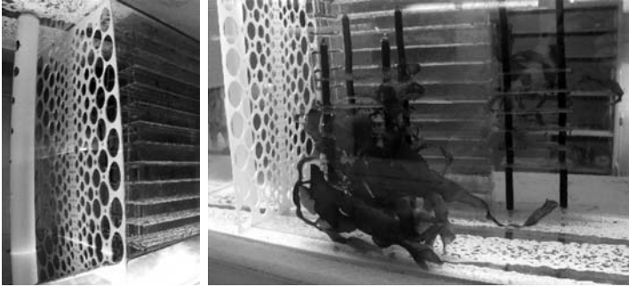
Рис. 5 (слева). Экспериментальные пластины с растущей ламинарией Рис. 4. Пластина и труба с отверстиями, выравнивающие гидродинамические потоки по вертикали и горизонтали

сле оседания зооспор пластины извлекались и в сумках-холодильниках доставлялись в Санкт-Петербург, где помещались в аквариумы.