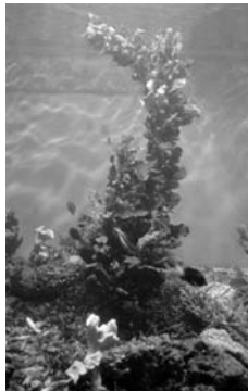
Рис. 6. Саргассовые водоросли в прибойной зоне

Опыт с фукусами продолжался в течение 7 месяцев. Периодически пластины вынимали и производили морфометрические измерения. При этом определяли следующие параметры: длина фотосинтезирующей части эмбриона (без учета ризоидов) и ее максимальный диаметр. Исходя из этих данных и принимая во внимание, что фотосинтезирующая часть эмбриона имеет форму усеченного конуса с закругленным основанием, рассчитывали объем и площадь поверхности эмбрионов, а также отношение длины эмбриона к его диаметру. Результаты опыта представлены в таблице.