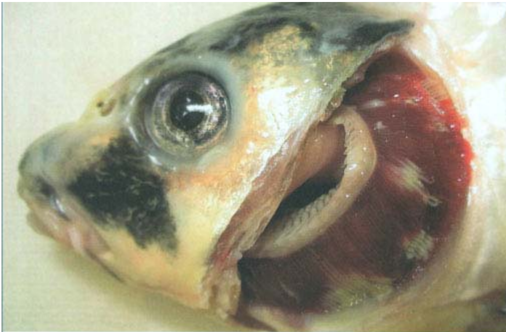
Рис. 1. Западение глаз и очаги некроза жабр у карпа кои больного KHVD

Следует отметить, что они не всегда наблюдаются одновременно у одной и той же особи. Тело больных рыб неравномерно окрашено, и участки шершавой кожи без слизи чередуются с чрезмерно ослизненными. К этому добавляется разрушение («растрепанность») плавников, кровоизлияния у их основания и на поверхности тела. Болезнь осложняется вторичными инфекциями (миксобактериоз, сапролегниоз) и протозойными эктопаразитами. Внутренние органы обычно не имеют существенных патологических изменений. Иногда отмечают увеличение передней почки, дряблость и неравномерную окраску сердца (Pokorova et al., 2005; Lio-Po, 2009).